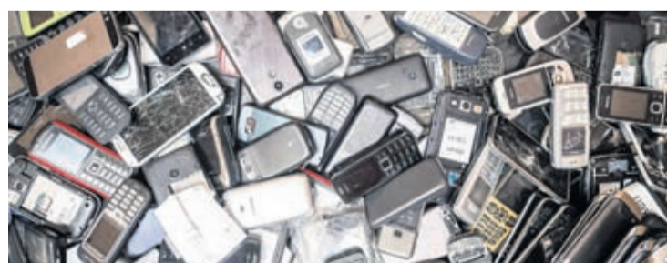
In this photo taken on July 13, 2018, old mobile phones fill a bin at the Out Of Use company warehouse in Beringen, Belgium.

The authors of the study calculated the combined weight of all dumped devices with a battery or a plug last year was the equivalent of 350 cruise ships the size of the Queen Mary 2. Among all the discarded plastic and silicon were large amounts of copper, gold and other precious metals — used for example to conduct electricity on circuit boards. While about